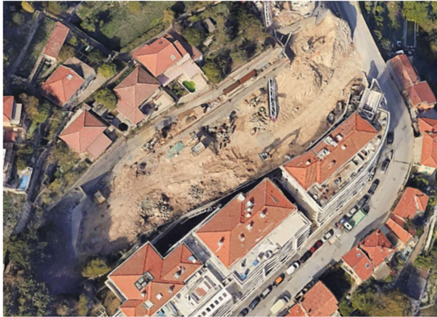
ci-dessous la vue aérienne non mise à jour du chantier MC Park: