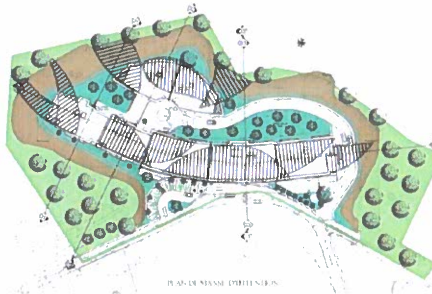
Plan masse d'intention du projet

Figure 2 - Plan-masse du projet – Les parties hachurées correspondent aux deux résidences - Source étude d'impact